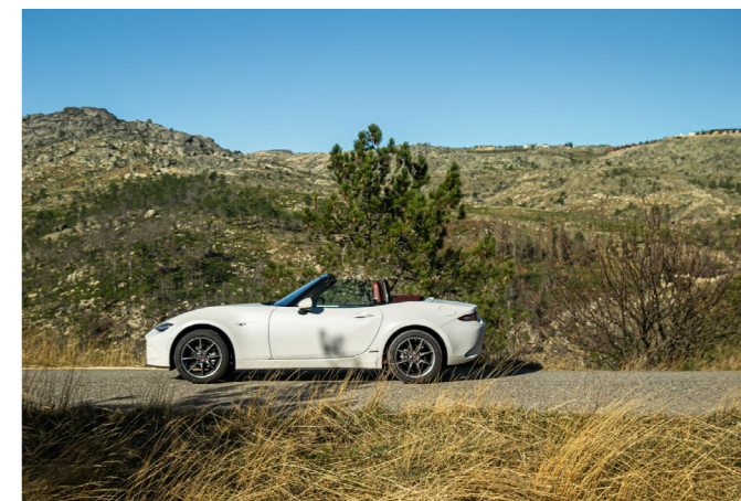
Artigo e galeria completa em www.agaragem.pt