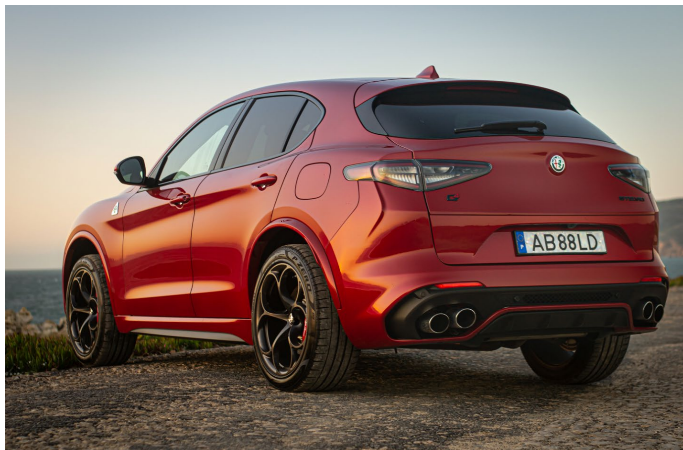
Artigo e galeria completa em www.agaragem.pt

Mas o que me choca mesmo, por ser tão contraditório, é apostar em carroçarias SUV para desenvolver versões mais eficientes ou, por oposição, desportivas. É, desde logo, sinónimo de mais trabalho para as marcas. A altura superior prejudica não só a aerodinâmica como também o comportamento e à partida, nunca funcionará tão bem quanto numa berlina, por exemplo. “Mas a malta pede e as marcas dão”, aquela frase que teimo em repetir, mas que é, simplesmente, verdade. São assim muitos os SUV híbridos com jantes gigantes e os SUV desportivos pesados e enormes. O Stelvio também é grande e pesado, e por isso custa-me aceitar que ele consiga fazer o que faz. E com a facilidade que o faz.